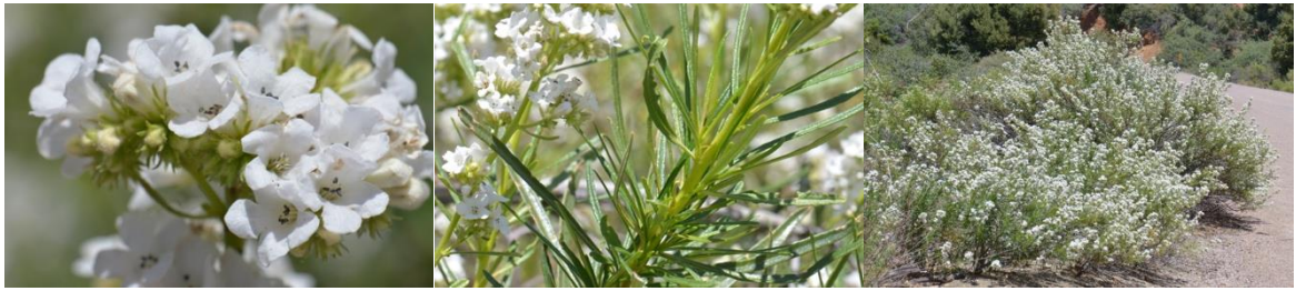
写真：ヤーバサンタ（エリオジクチオン属）