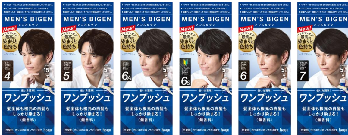
メンズビゲンワンプッシュ 全6SKU

※ インテージ SRI+/白髪男性用ヘアカラー市場/販売金額/2025 年 1 月～2025 年 12 月