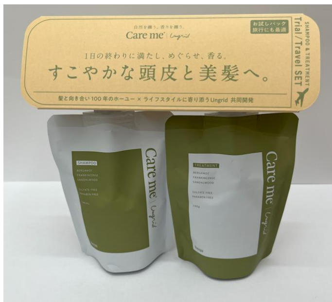
ダンボール紙を使用したセット販売用資材

入賞対象は、2024年6月より販売を開始した「Care me シャンプー&トリートメント トライアル&トラベルセット」のセット販売用資材です。ダンボール紙を使用し、特殊形状により視認性と強度を両立。ブランドの世界観を表現するデザイン性も兼ね備え、環境負荷の低減とコストダウンを実現しました。なお、資材の製造は土岐ダイナパック株式会社が担当しています。