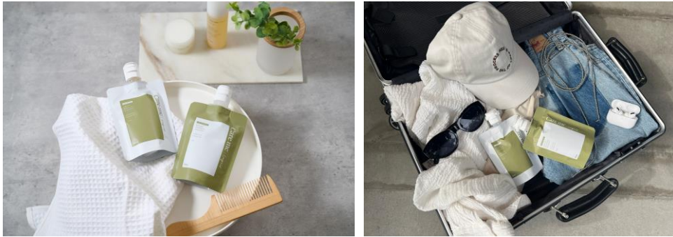
〈「Care me シャンプー&トリートメント トライアル&トラベルセット〉