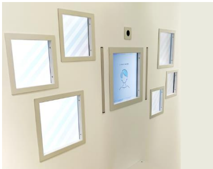
「なりたい自分を探す」(シミュレーター)