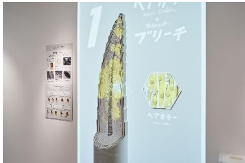
「仕組みに驚く」(プロジェクションマッピング)