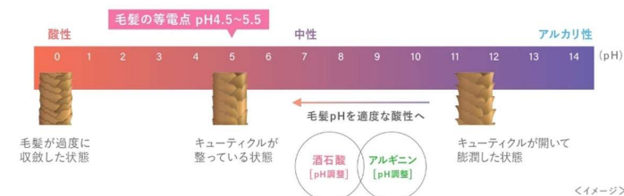
イメージ1：バッファー効果